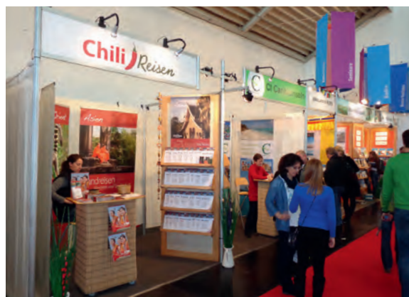
Komplett eingerichtete kleine Messestände, ab 1,5m breit, individuell dekoriert und mit Firmenschild. Jeder weitere Quadratmeter verbreitert den Stand um einen halben Meter.

of 3 sqm from us. These can be booked with lights, shelves, chair and counter. Thus you are represented in an agreeable surrounding. If Your staff is not available or on weekdays that are not important to you, we can look after your stall as well.