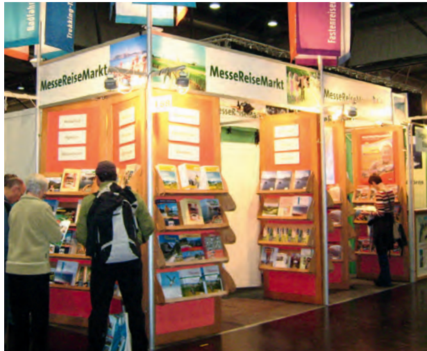
Alle Auslagen sind gut einsehbar. Wer immer in den obersten beiden Ablagen und ganz vorne platziert sein möchte, bucht "premium" mit 25% Aufschlag.

Trade fairs are an important area of representation and it takes a lot of time and money to represent yourself personally. Since 1990 we offer successfully our alliance stall as an affordable alternative. We display the brochures of tour operators, tourist resorts and - regions. Furthermore, in contrast to the individual stall, the alliance stall offers the visitor an attractive mixture.